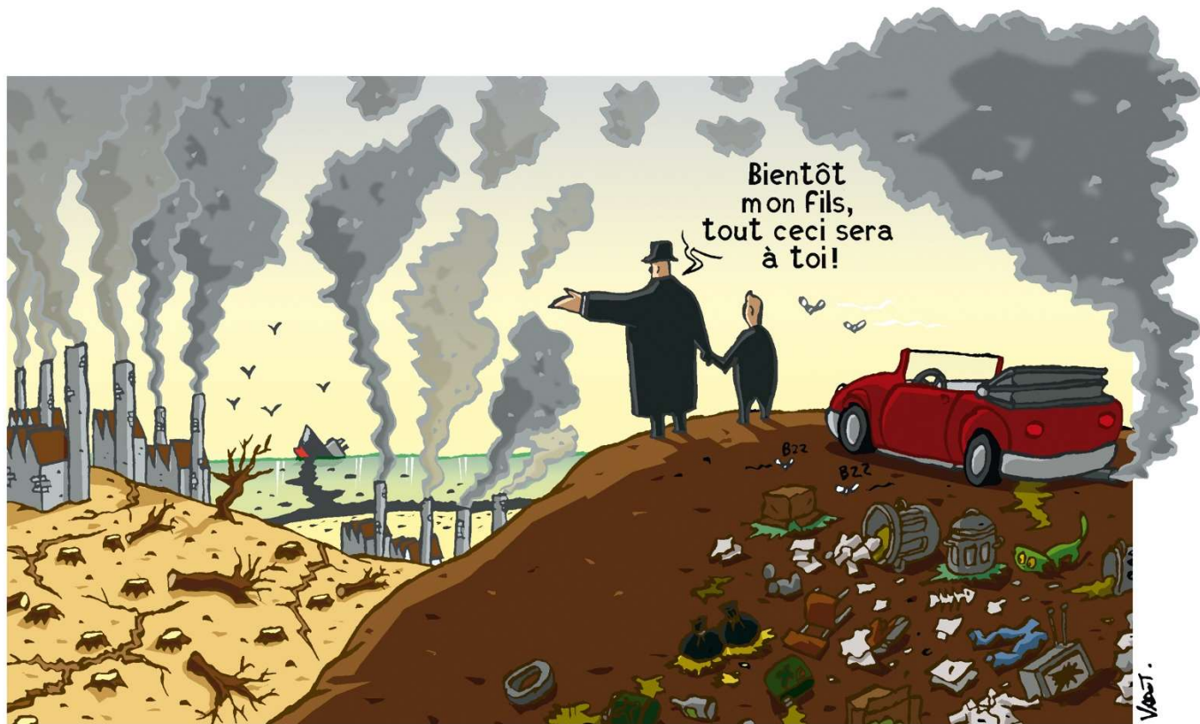
Paru dans Le Vif/L'Express (Bruxelles) le 4 février 2000. © Vadot, 2000